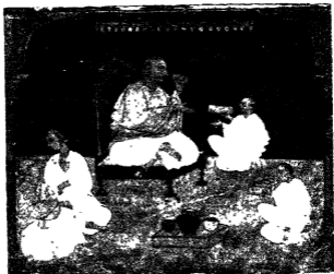
श्री जिनराजसूरि [सं० १६८१ में चित्रित]